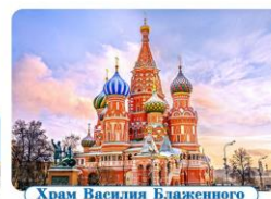
Храм Василия Блаженного