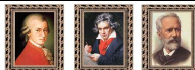
1. Моцарт 2. Бетховен 3. Чайковский

В ответе укажи только номер выбранного варианта (1 или 2 или 3)