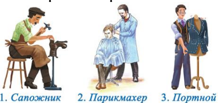
1. Сапожник 2. Парикмахер 3. Портной

В ответе укажи только номер выбранного варианта (1 или 2 или 3)