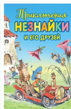
В. ПРИКЛЮЧЕНИЯ НЕЗНАЙКИ И ЕГО ДРУЗЕЙ