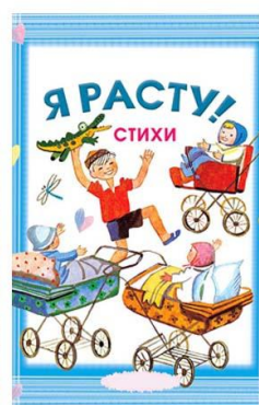
Б. Я РАСТУ