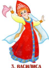
3. ВАСИЛИСА ПРЕМУДРАЯ

В ответе укажи только номер выбранного варианта (1 или 2 или 3)