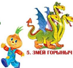
5. ЗМЕЙ ГОРЫНЫЧ