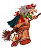
1. БАБА ЯГА

В гости к героям русских народных сказок пожаловал иностранный персонаж. Сумеешь ли ты его найти?