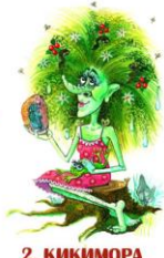
2. КИКИМОРА БОЛОТНАЯ