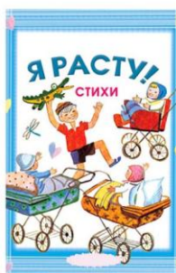
Б. Я РАСТУ