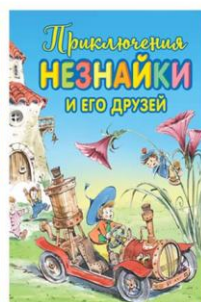
В. ПРИКЛЮЧЕНИЯ НЕЗНАЙКИ И ЕГО ДРУЗЕЙ