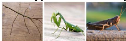
1 ПАЛОЧНИК 2 БОГОМОЛ 3 САРАНЧА

Речь пойдет о необычном насекомом. Это одно из крупнейших насекомых на планете. Он может достигать тридцати сантиметров в длину, представляешь? А ещё он прекрасно умеет маскироваться под прутик или веточку !