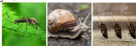
1 КОМАР 2 УЛИТКА 3 ТАРАКАН

Увлекательное задание. Кто есть кто? Знаешь ли ты, кто из этих существ не является насекомым?