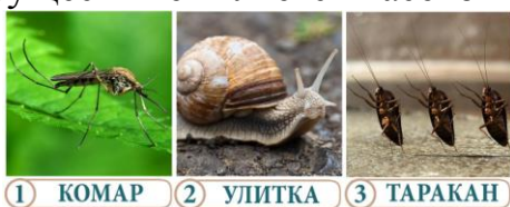
1 КОМАР 2 УЛИТКА 3 ТАРАКАН

Увлекательное задание. Кто есть кто? Знаешь ли ты, кто из этих существ не является насекомым?