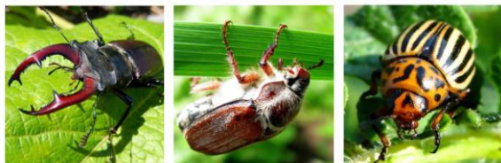
1 Жук-олень 2 Майский жук 3 Колорадский жук

Насекомое крайне прожорливое и может оставить нас без урожая. Поэтому мы с ним активно боремся и уничтожаем. Назови этого прожорливого вредителя!