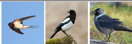
1 ЛАСТОЧКА 2 СОРОКА 3 ГАЛКА

В ответе укажи только номер выбранного варианта (1 или 2 или 3)