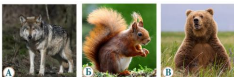
1 БЕРЛОГА 2 ЛОГОВО 3 ГАЙНО

У каждого живого существа есть дом, где он отдыхает и воспитывает потомство. Домики различных животных называются по-разному. На нашей картинке все перемешалось и это делает задание еще интересней! Думаю, тебе не составит труда определить, кто где обитает.