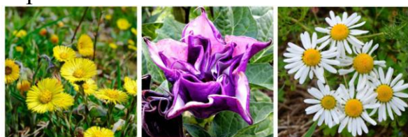
1 МАТЬ-И-МАЧЕХА 2 ДУРМАН 3 РОМАШКА

Ты же знаешь, что в природе много лекарственных трав, но есть и ядовитые. Выбери из списка ядовитое растение.