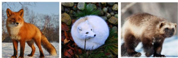
1 ЛИСА 2 ПЕСЕЦ 3 РОСОМАХА

Она – полноправная хищная хозяйка тайги. Внешне напоминает уменьшенную копию медведя. Вот только хвост у этого "медведя" относительно длинный и пушистый. А благодаря своим большим и широким лапам этот зверь почти не проваливается в сугробы и легко передвигается по снегу.