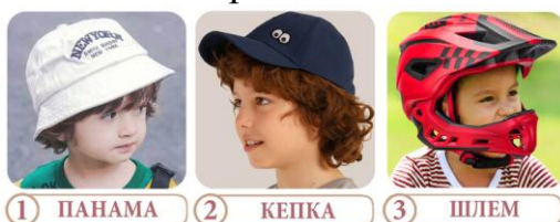
1 ПАНАМА 2 КЕПКА 3 ШЛЕМ

Ты любишь кататься на роликах и гонять на велосипеде? А выписывать зигзаги на скейтборде тоже любишь? Тогда ты непременно подскажешь нашим друзьям, какой головной убор защитит голову от возможных травм?